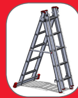
סולם עומד דו צדדי