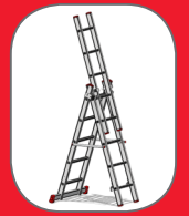
סולם עומד דו צדדי עם קטע הארכה