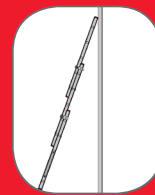
סולם נשען תלת חלקי